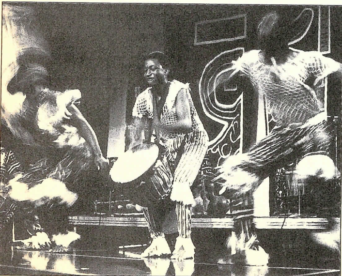
Farafina (Bielefeld, JZ Kamp, 20.30 b)

MÜNSTER: 22.00 Sunday Cult Classics & Funky Stuff mit DJ R.O.M. (Go Go) 22.00 Soul, Funk, Jungle (Depot)